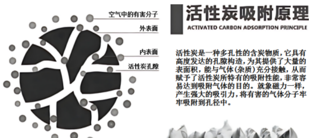
图 4.1-2 活性炭吸附原理图